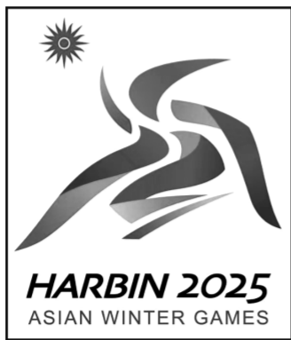
第九届亚冬会会徽

2025年第九届亚洲冬季运动会会徽“超越”，由清华大学美术学院精心设计，蕴含着新时代中国加速体育强国建设的坚定信念，以及对更高、更快、更强目标的执着追求。会徽巧妙融合了短道速滑运动员的冲刺姿态、哈尔滨市花丁香花以及亚奥理事会的太阳图标，这一设计不仅彰显了中国文化的博大精深，更体现了奥林匹克精神的精髓。同时，它也预示着亚洲冰雪运动将迎来新的发展高峰，共同谱写冰雪运动的辉煌篇章。